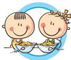
ПИТАЙТЕСЬ КАЖДЫЙ ДЕНЬ ВМЕСТЕ С ОДНОКЛАССНИКАМИ В ШКОЛЬНОЙ СТОЛОВОЙ