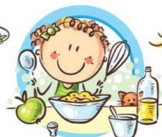
СЛЕДУЙТЕ ПРИНЦИПАМ ЗДОРОВОГО ПИТАНИЯ И ВОСПИТЫВАЙТЕ ПРАВИЛЬНЫЕ ПИЩЕВЫЕ ПРИВЫЧКИ