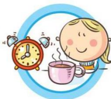
СОБЛЮДАЙТЕ ПРАВИЛЬНЫЙ РЕЖИМ ПИТАНИЯ