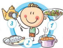
НЕ ПРОПУСКАЙТЕ ПРИЕМЫ ПИЩИ